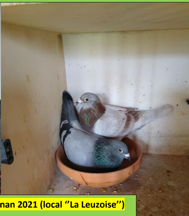
Perpignan 2021 (local "La Leuzoise")